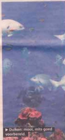
► Duiken: mooi, mits goed voorbereid.